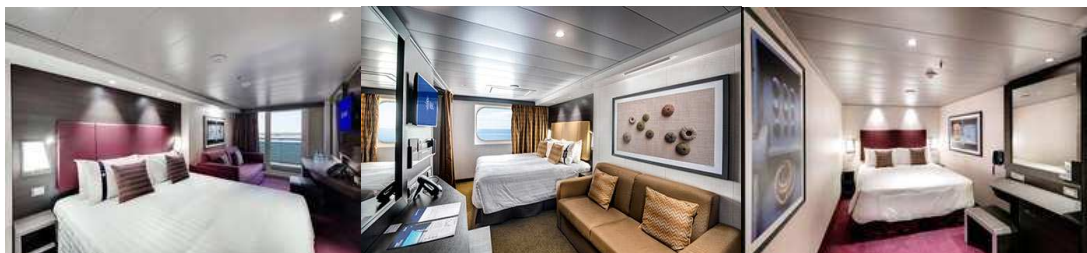
Cabina con balcone